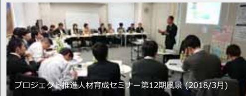
プロジェクト推進人材育成セミナー 第12期風景 (2018/3月)