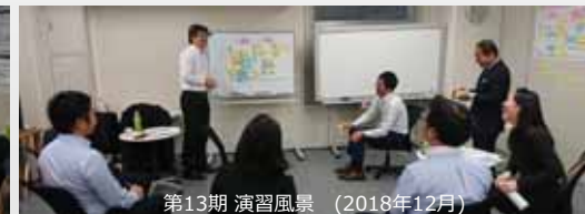
第13期 演習風景 (2018年12月)